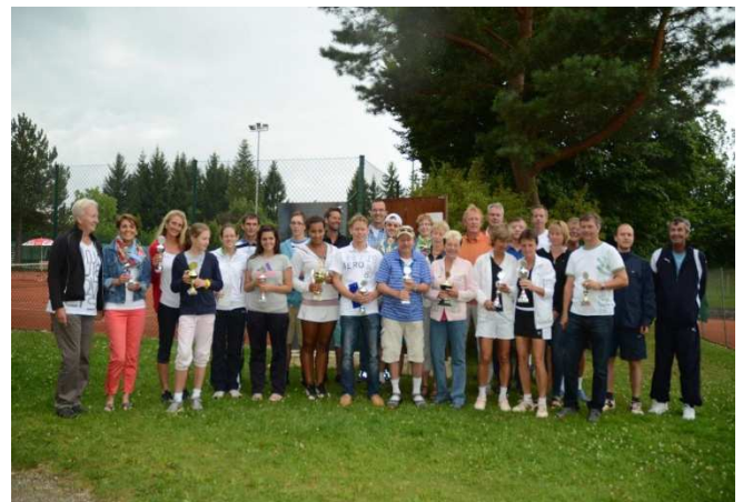
Sieger und Platzierte bei den ersten offenen Tennis-Clubmeisterschaften des SV-Lohhof

Nach den Mannschaftswettbewerben fanden dieses Jahr – zum ersten Mal „open“ – vom 27. – 29. Juli die Tennismeisterschaften des SV-Lohhof statt.